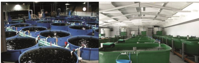
Abb. 3: Kreislaufanlage für Tilapia (links) und Zander (rechts)

Die Teilnehmer der Studie sehen hohen Entwicklungsbedarf in der Haltung des Öko-Sektors gegenüber Innovationen. Darüber hinaus sollten Tierwohl- und Nachhaltigkeitsaspekte der Methode genauer untersucht werden. Zukünftig könnten Alternativen zu einer formalen EU-Öko-Zertifizierung geschaffen werden. Eine Anerkennung der Kreislaufanlagen als Öko-Produktionsmethode gemäß der EU-Öko-Verordnung darf allerdings nicht ausgeschlossen werden. Hierfür wäre die Vorarbeit der Beteiligten unverzichtbar.